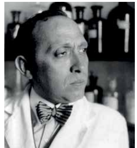
Figure 1: Bernhard Zondek (1891-1966).

La FSH intègre une famille d'hormones glycoprotéiques, caractérisées par une sous-unité alpha commune et une sous-unité bêta, spécifique de leur action biologique. Au cours de son assemblage et de la dimérisation alpha/bêta dans la cellule gonadotrope, la FSH parcourt un itinéraire allant du réticulum endoplasmique vers l'appareil de Golgi. Ce faisant, les deux sous-unités incorporent des résidus glyqués, qui modifient la vie plasmatique de l'hormone et modulent son action biologique dans les tissus (3). En fonction de leur composition en résidus glucidiques, on observe plusieurs fractions ou isoformes de FSH dans le sérum. La FSH se lie à un récepteur spécifique (FSHR) transmembranaire exprimé dans les gonades et les différents tissus, incluant l'os et le système nerveux central. La stimulation de la folliculogenèse chez la femme au cours du