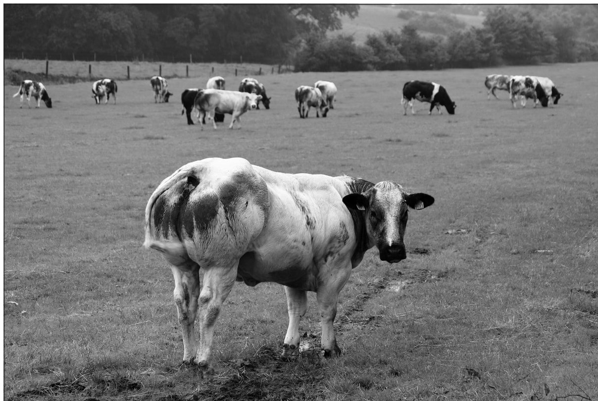
Photo 6. Race bovine Blanc Bleu Belge