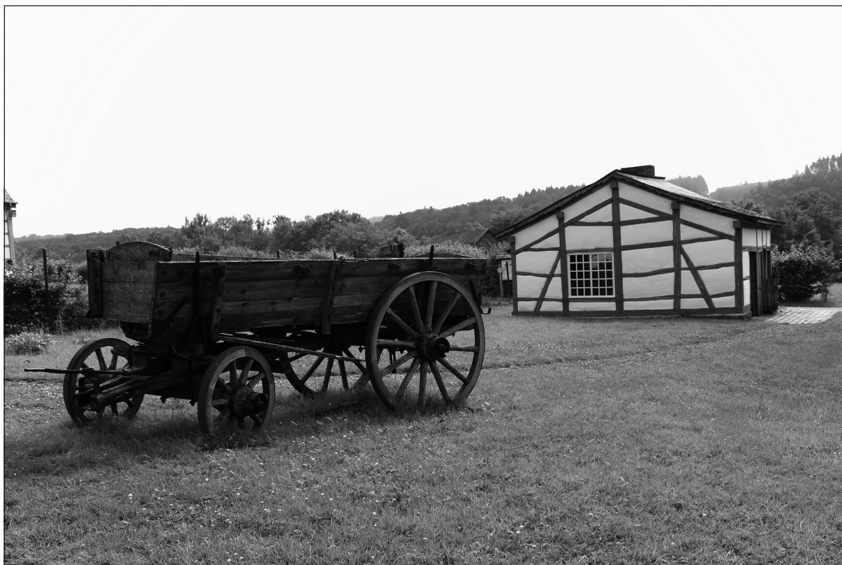
Photo 7. Une maison ardennaise reconstituée au domaine du Fourneau Saint-Michel

Le dernier arrêt au domaine muséal du Fourneau Saint-Michel est quelque peu anachronique parce qu'il nous présente une ruralité passée et oubliée mais aussi parce qu'il correspond à une façon de préserver le patrimoine qui ne correspond plus au crédo de la protection du patrimoine actuelle qui privilégie le maintien sur site et la recherche de nouvelles fonctions. Ce site d'environ 50 ha « a pour caractéristique d'être composé de bâtiments anciens, démontés dans leur village d'origine et reconstruits sur le domaine, ou seulement reconstitués à l'identique. On compte une soixantaine de bâtisses, affectée en lieux de vie et d'ateliers d'artisans, mais aussi de réserve pour les 50.000 objets de collection, ou encore en espaces de travail pour le personnel. Ils sont organisés en hameaux typiques de l'architecture rurale traditionnelle wallonne du sud du Sillon Sambre-et-Meuse : habitations, fermes, chapelle, école » (Peuckert, 2016, p. 88) (Photo 7). Le domaine touristique et culturel du Fourneau Saint-Michel offre une mise au vert et une découverte de la ruralité wallonne au