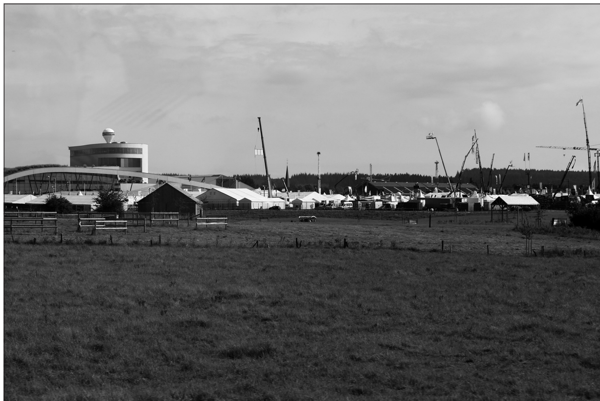
Photo 5. Vue sur la Foire de Libramont

Le dernier jour a commencé par une visite de la foire de Libramont. Cette immense exposition en plein air accueille, chaque année, plus de 220.000 visiteurs, avec 800 exposants et 5.000 marques, sur un site couvrant 300.000 m 2 (Photo 5). Il s'agit d'une vitrine remarquable pour le monde rural : la machinerie, l'élevage, la sylviculture, l'industrie agroalimentaire, l'horticulture, la recherche, l'éducation et la culture. C'est un événement économique qui promeut les métiers ruraux dont l'agriculture, l'élevage, la sylviculture. Cette foire met en avant les dernières innovations et pratiques techniques. Elle permet d'avoir une vision large de l'agriculture et des pratiques de développement rural en Wallonie et en Belgique et permet de débattre sur l'avenir et les défis de l'agriculture. Une attention particulière est aussi accordée à une agriculture et à une