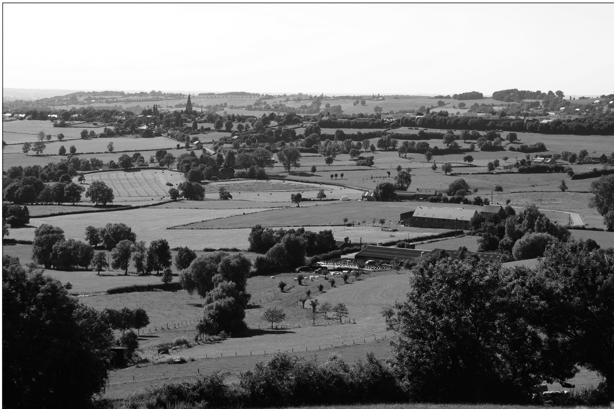
Photo 1. Paysage de bocage de l'Entre-Vesdre-et-Meuse vu du cimetière américain de Henri-Chapelle

Pourtant ce paysage « idyllique » et regretté ne remonte pas à des temps immémoriaux. Au Moyen Âge, les paysages de cette région étaient plus proches d'un système agricole ouvert avec de nombreux labours. À partir du 15 e siècle, la fabrication et le commerce de la laine et des tissus deviennent importants dans la vallée de la Vesdre, notamment à Verviers et à Eupen. La laine provient des moutons qui parcourent les abondantes landes avoisinantes. Au 16 e siècle, le paysage de l'Entre-Vesdre-et-Meuse se modifie et de nouvelles pratiques apparaissent liées à l'essor de l'élevage, la