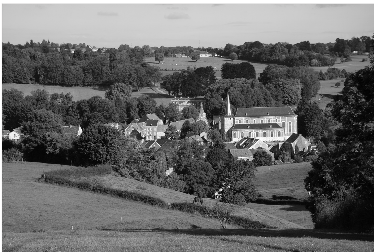
Photo 2. Le village de Soiron