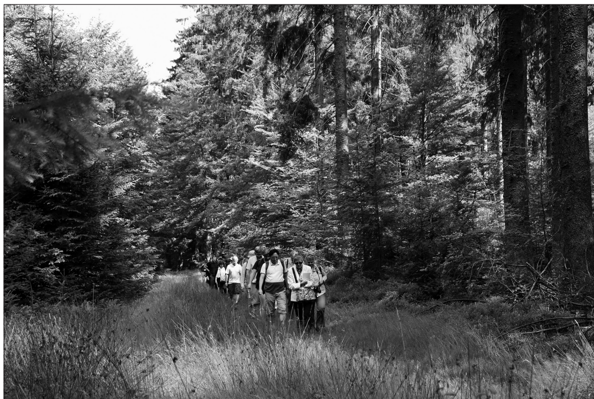
Photo 4. La forêt jardinée du Grand Bois à Vielsalm