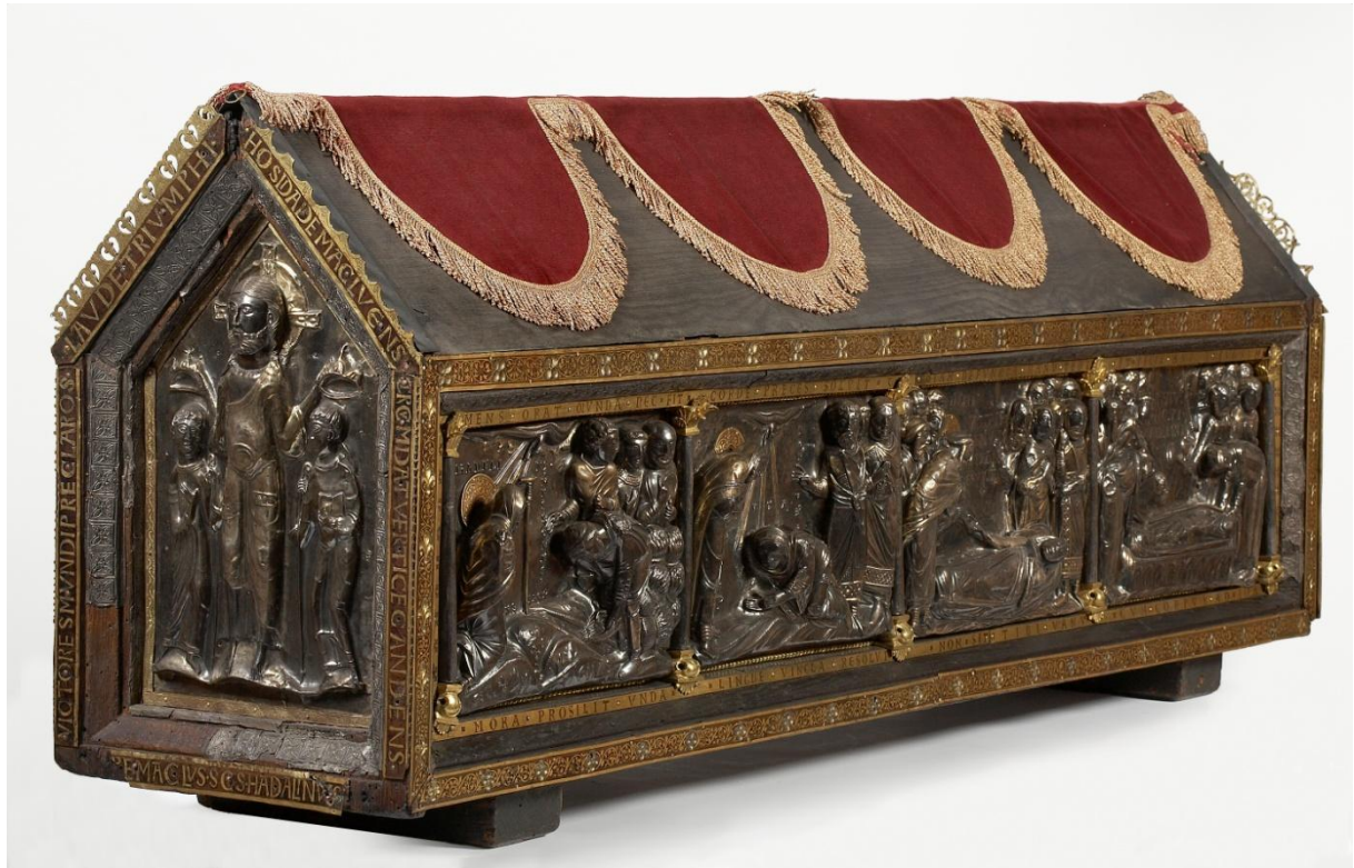
Visé - Châsse de saint Hadelin