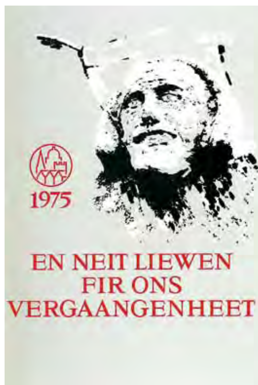
Fig. 2: Couverture de la brochure distribuée dans le cadre de l'exposition itinérante En neit Liewen fir ons Vergaangenheet – Une nouvelle vie pour notre passé