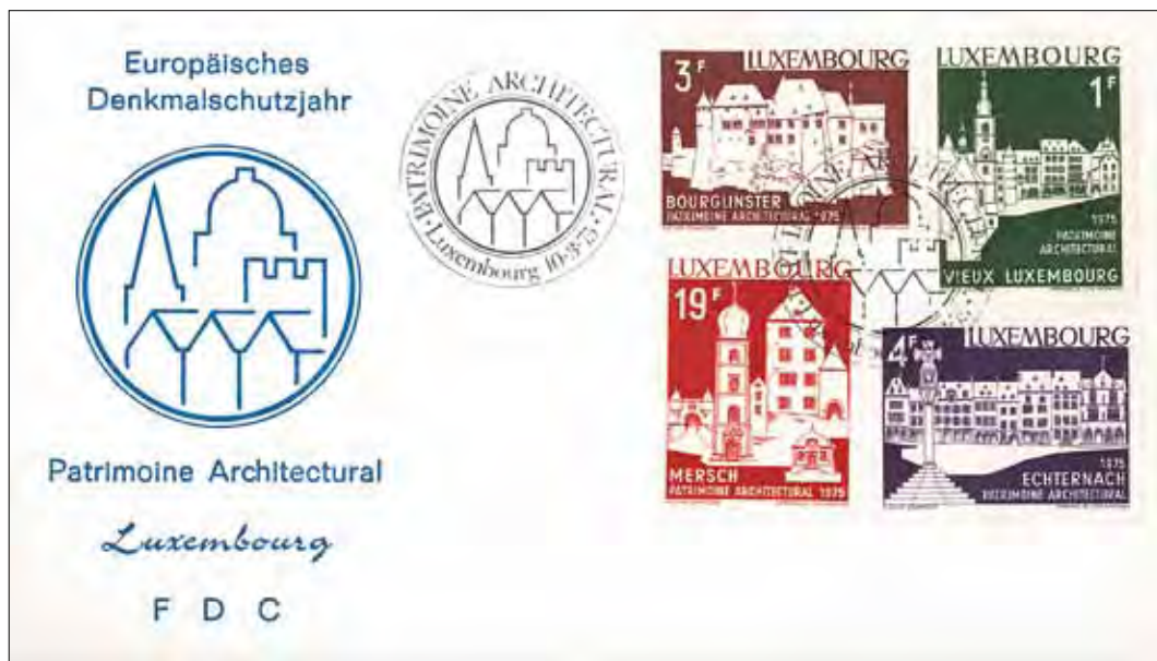
Fig. 1: Série de timbres émis par la poste luxembourgeoise (de gauche à droite et de haut en bas): le Château de Bourglinster (3F), le Marché-aux-Poissons à Luxembourg (1F), la Place Saint-Michel à Mersch (19F), la Place du Marché à Echternach (4F)

En premier lieu, la poste luxembourgeoise – à l'imitation de nombreuses postes en Europe – émet une série de quatre timbres consacrés à des architectures emblématiques du patrimoine national. Ces timbres spéciaux furent diffusés dès le 10 mars 1975 (Communiqué 1975) et portaient la mention « patrimoine architectural » (fig. 1). Ils présentaient les sites emblématiques suivants : le Marché-aux-Poissons à Luxembourg, le Château de Bourglinster, la Place du Marché à Echternach et la Place Saint-Michel à Mersch. Les motifs avaient été dessinés par Alfred et Christiane Steinmetzer, deux personnalités qui ont joué un rôle quant à la conservation du patrimoine architectural au niveau national. Par le biais de ce support, la campagne lancée par le CoE entra pratiquement dans tous les foyers. Les timbres manifestèrent également la participation luxembourgeoise au-delà des frontières du pays.