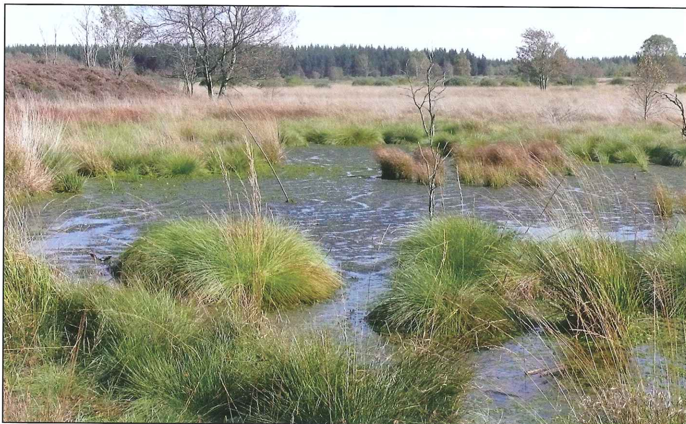
Nouveau plan d'eau colonisé par les sphaignes dans un lithalse de Misten.

Rochon, A., de Vernal, A., Sejrup, H.-P., Hafliadason, H. 1998. Palynological evidence of climatic and oceanographic changes in the North Sea during the Last Deglaciation. Quaternary Research 49, 197-207.