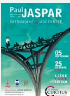
Affiche de l'exposition

01 Exposition s'étalant du 5 septembre 2009 au 25 octobre 2009.